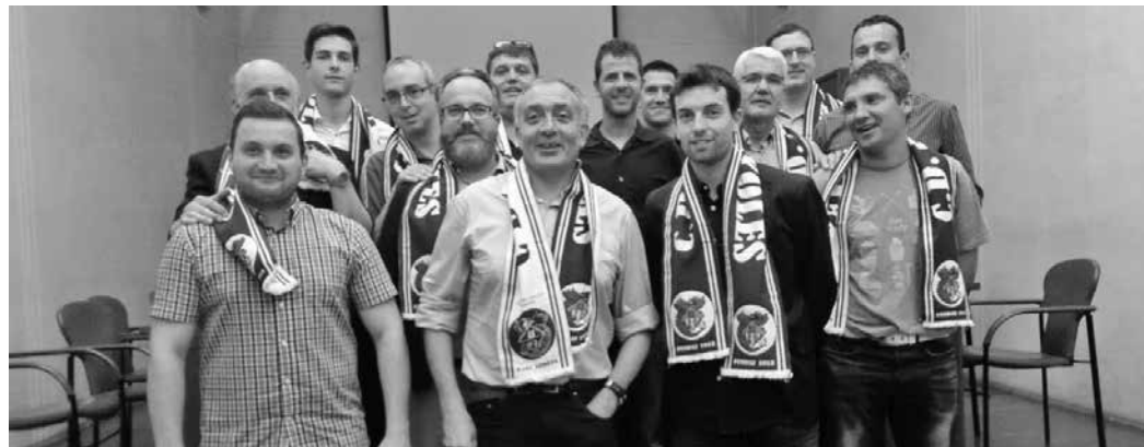
NOVA JUNTA DIRECTIVA PER A LA TEMPORADA 2015-2016